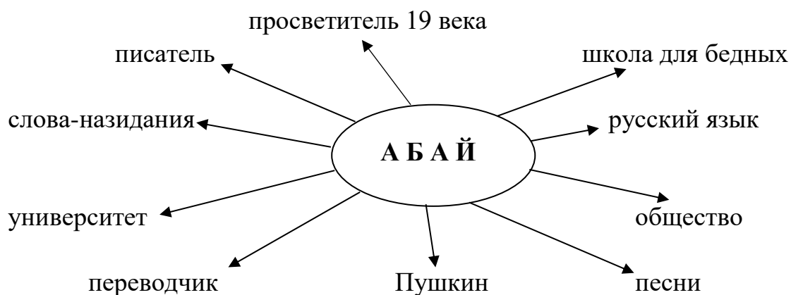
Ассоциативная схема 1.3.3.

С полученным перечнем слов составляем устный импровизированный текст, который служит концептуальным фоном для восприятия нового текста. Например: Абай – великий казахский писатель 19 века. Он является одним из первых писателей-просветителей, автором многих произведений стихотворений. Он родился в обеспеченной семье. Много читал, интересовался творчеством писателей-классиков русской и зарубежной литературы: Пушкиным, Лермонтовым, Достоевским. Занимался переводческой деятельностью. Перевел на казахский язык фрагменты романа в стихах Пушкина «Евгений Онегин».